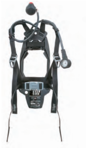
Dräger PAS® Lite

Incorporando novos materiais moldados e formados para fornecer o máximo de conforto nos ombros e na cintura, o arnês foi desenvolvido para reduzir o esforço, o stress e a fadiga nas costas. O design inovador dos arreios garante uma excelente distribuição do peso nos ombros. A inclusão de tecido revestido de borracha durável fornece excelente conforto ao vestir e resistência a produtos químicos, ao mesmo tempo em que mostrou bom desempenho durante o teste de resistência às chamas de acordo com EN137 Tipo 2.